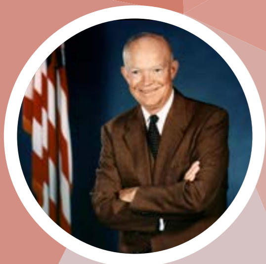
Dwight D. Eisenhower

Nel prepararsi per una battaglia ho sempre scoperto che i progetti sono inutili, ma la pianificazione è indispensabile.